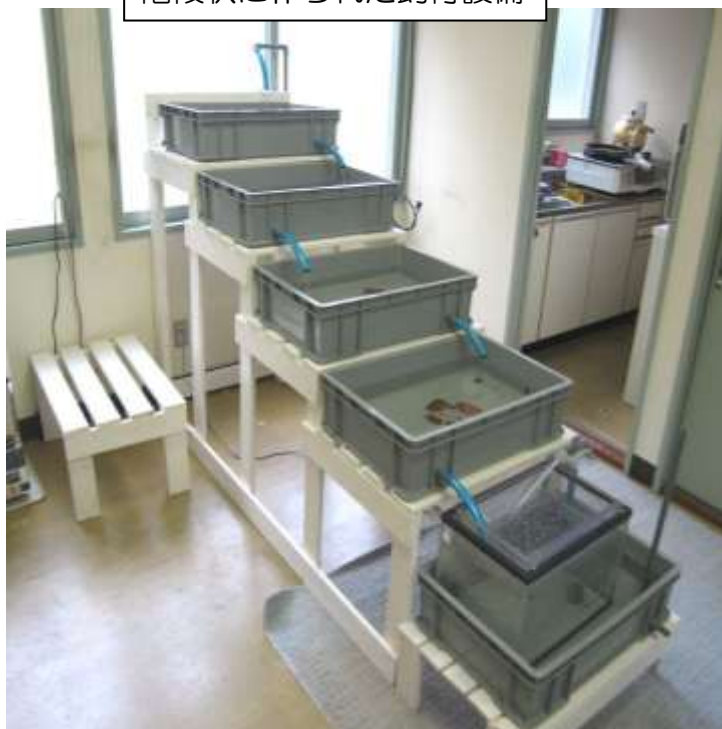
階段状に作られた飼育設備