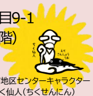
厚別南地区センターキャラクター ちく仙人(ちくせんじん)