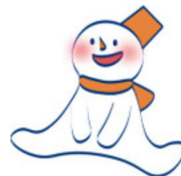
新さっぽろ冬まつりキャラクター (ゆきころん)

※ 開催時間が異なります。区ホームページまたは区役所などで配布するチラシをご確認ください。