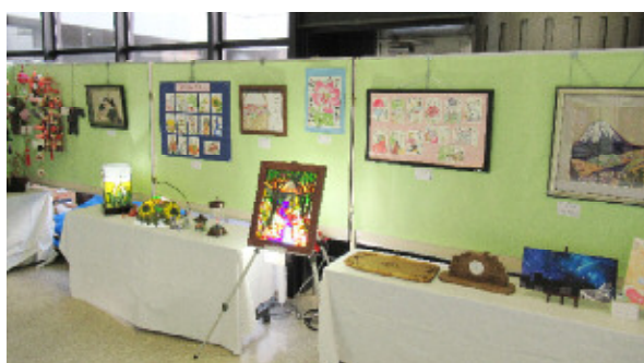
絵手紙・工芸品コーナー