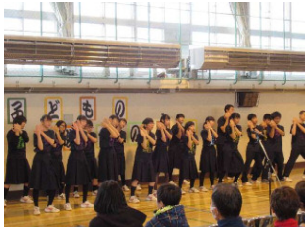
青葉中合唱部の生徒がパプリカを踊りながら合唱してくれました。

青葉小学校での開催は今回が最後となりますが、地域の皆さんにとって思い出となる1日になったのではないのでしょうか。