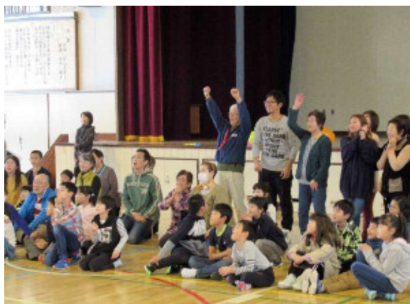
ピカットくん投げチーム対抗戦の結果が発表されると大きな歓声が上がりました。