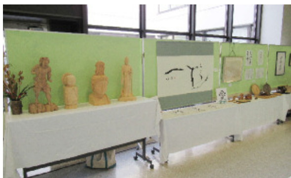
書・木作品コーナー