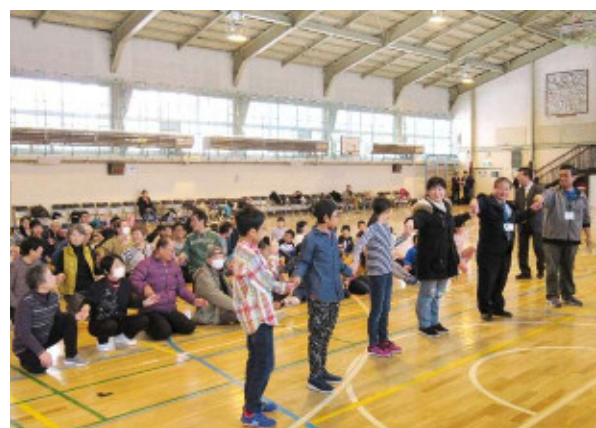
青葉小の児童がジュニアチームリーダーとなり、企画したゲームを説明している様子。