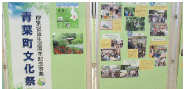
町連活動紹介コーナー