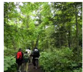
<森林浴ウォーキングの様子>

6月に区の事業「ファミリー森林浴ウォーキング」に参加しました。森林公園を歩きながら、鳥のさえずりや草花を見てリフレッシュができました。身近な青葉中央公園にも自然があふれています。公園へ森林浴や自然観察に行ってみませんか。