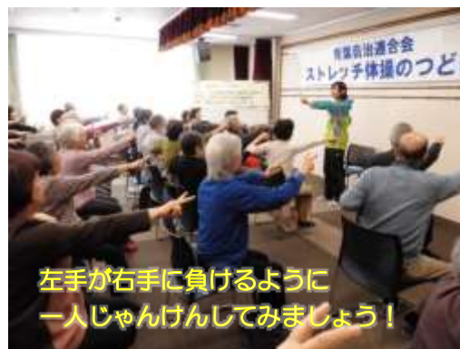
左手が右手に負けるように 一人じゃんけんしてみましょう！

当日は70名を超える町内の方々が参加され、札幌市中央区の健康づくりセンターから派遣された講師をお手本に、体を動かしました。