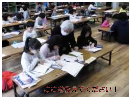
ここを教えてください！

青葉児童会館に通う小学生たちが、自分の学習教材を持って集まり、朝9時から10時まで、集中して勉強に取り組みます。