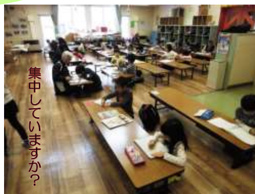
集中していますか？