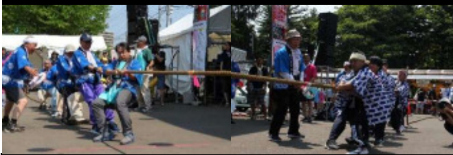
第30回 厚別区民まつり（綱引き）

この他にも地域では ・ 国道12号線花いっぱいプロジェクト ・ 厚別西地区大運動会 ・ ふるさと青葉コンサート 等々 各種団体では ・ 厚別区誕生30周年記念講演会 ・ 厚別区子どもまつり 等々 数多くの記念事業が実施されました。