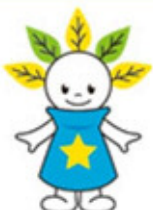
厚別区マスコットキャラクター 「ピカットくん」

屋外で過ごす機会も増えると思いますが、熱中症などには十分注意して楽しい夏を過ごしてください。