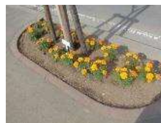
▲フラワータウン事業