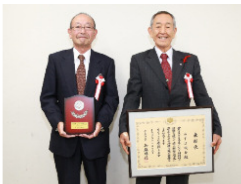
▲酒井さん（左）と高澤会長（右）