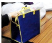
温かなお弁当を届けるために…▲