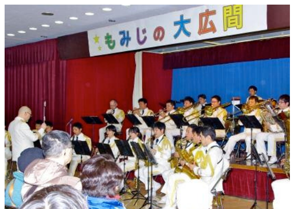
▲迫力満点の消防音楽隊コンサート