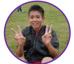
昨年に続き ジョギングチャンピオン