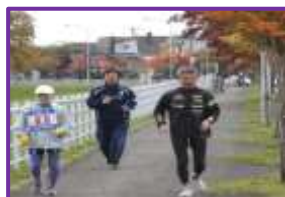
ご自身は一度ゴールし お迎えに戻ってから併走 美しすぎます