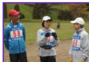
参加者同士の コミュニケーション 大切ですね!