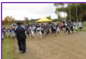
一斉にスタート! 最初はみーんな ウサイン・ボルト

もみじ台体育振興会が主催し、もみじ台自治連合会が共催する「第32回もみじ台ウォーキング&ジョギング大会」が、10月12日の体育の日、もみじ台東側緑地運動公園で開催されました。当日は肌寒い気温ではありましたが多くの方々が参加され、ご自身の体力に合わせて爽やかな汗を流していました。さて筆者の私事です、昨年この大会の取材で走り回ったところ、足がつりそうになりました〜お恥ずかしい。今回については数か月前から運動に心がけてきたことが功を奏し、カメラのシャッターを切りながらも参加ランナーに併走することができましたよ（ゼエゼエ…涙）。