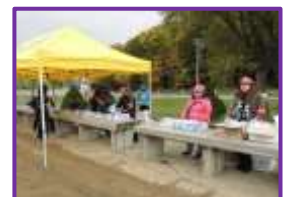
大会には必ず裏方さんの 支えがあります♥