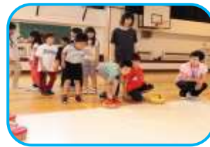
もみじの丘小 サタデースクールから