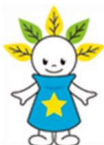
厚別区マスケットキャラクター 「ピカットくん」

これからの季節、大雨などによる洪水や土砂災害の危険性が高まります。皆さん、洪水ハザードマップをお持ちですか？ハザードマップで自宅の災害リスクを確認するとともに、万一来襲に備え、避難方法の確認や、非常持ち出し品の準備を心掛けましょう。