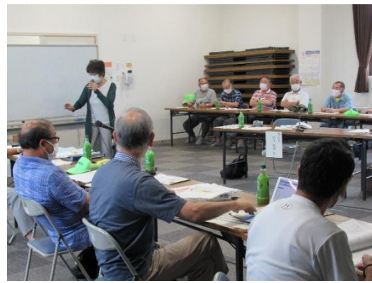
▲活発な意見交換が行われた机上訓練の様子