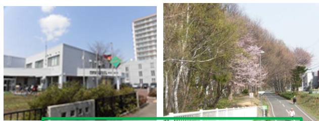
南まちセン・陽だまりロード（4月）

厚別南地区が開拓されたのは明治18年。大谷地周辺が水田地帯、上野幌周辺が農業・酪農地帯として発展していました。「陽だまりロード」は廃線になった旧千歳線跡にできたもので、市境を越えるとエルフィンロードとしてJR北広島駅まで続いています。