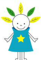
厚別イベントキャラクター 「ピカットくん」