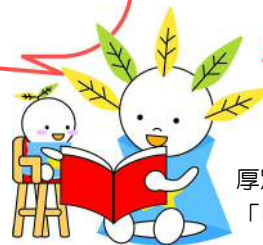
厚別イベントキャラクター「ピカットくん」