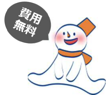
新さっぽろ冬まつりキャラクター （ゆきころん）

※ 開催時間が異なります。区ホームページまたは区役所などで配布するチラシをご確認ください。