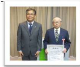
【写真】 浅野区長（左） 日下会長（右）