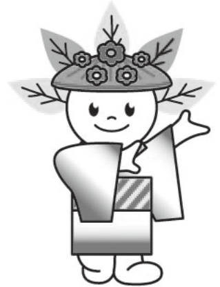
厚別区マスコットキャラクター「ピカットくん」