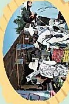
とうべつ軽トラマーケット

おまつりやコンサートなど各種イベントにご利用いただけます。 厚別区厚別町地区は、若交通の拠点があり、多くの人が集まる地域です。ここには、市内初の市民交流広場「ふれあい広場あつべつ」と数々の設備を持つ「科学館公園」があり、遊びや憩いの場としてにぎわっています。