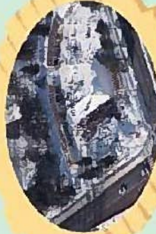
新さっぽろ冬まつり