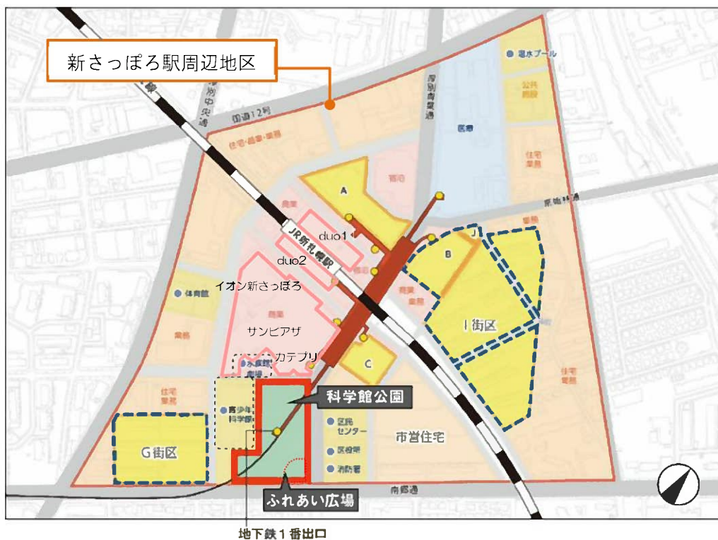
図 1-2 新さっぽろ駅周辺施設概要図

※3…I街区は、市営住宅跡地に㈱札幌副都心開発公社が所有する図1-2（P.3）のBを加えて大街区化を行った開発可能地