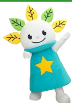
厚別区マスコットキャラクター 「ピカカットくん」