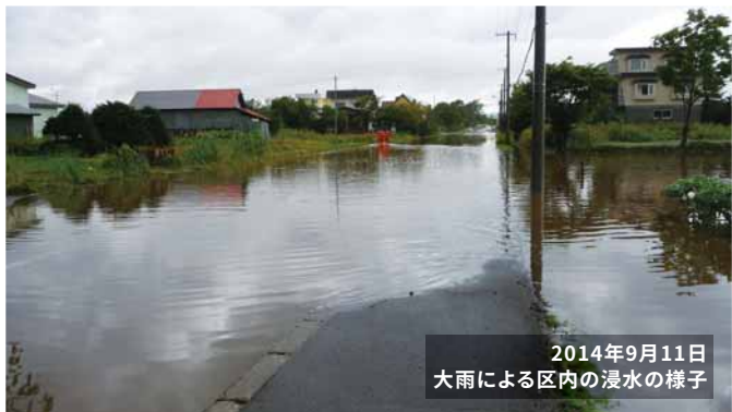
2014年9月11日 大雨による区内の浸水の様子