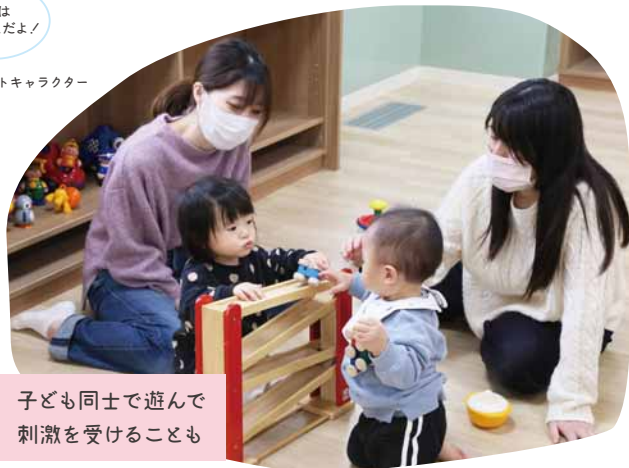
子ども同士で遊んで 刺激を受けることも

親子が自由に遊ぶことができる子育てサロンです。0歳から就学前のお子さんと保護者が利用することができます。保育士が常駐しており、子育ての情報提供や相談も受け付けている他、身体測定や絵本の貸し出しも行っていきます。初めての利用は子どもも大人も緊張すると思いますが、職員が案内しますので安心してお越しください。