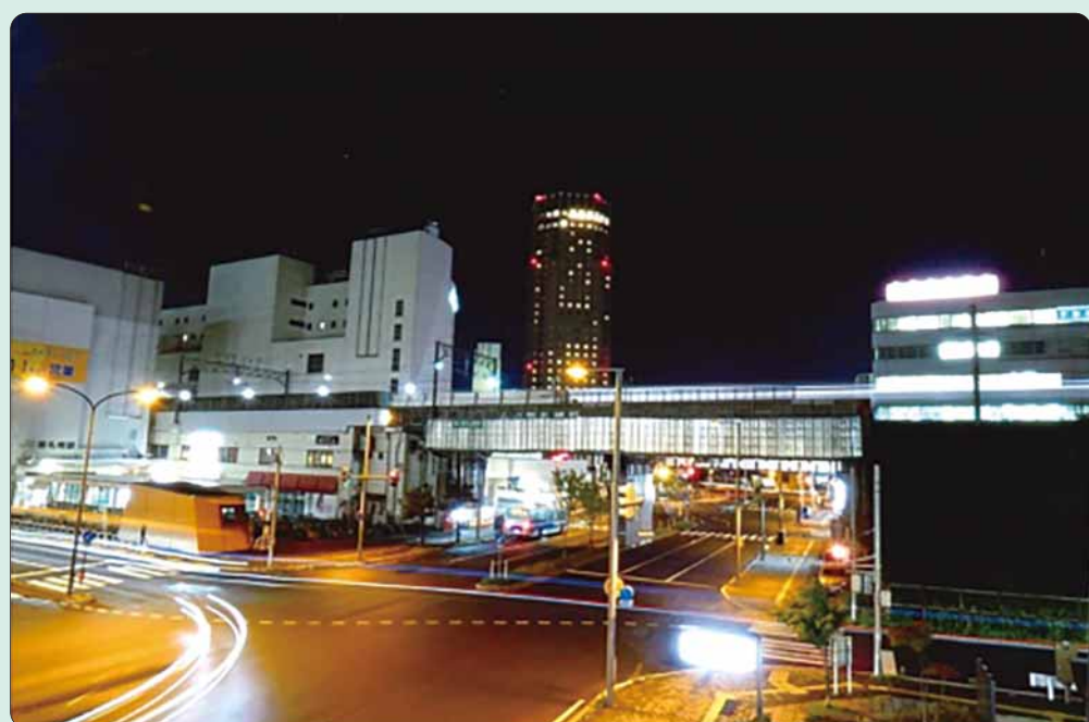
「電車と車の光跡」 たかはし ゆうま 高橋 佑季さん 撮影場所: 新札幌駅前歩道橋