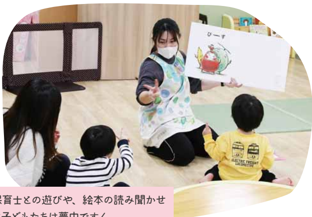
保育士との遊びや、絵本の読み聞かせ に子どもたちは夢中です！

昨年市外から転入してきた際にチラシを見て興味を持ちました。子どもが広いところで伸び伸びと遊ぶことができ、子ども同士・親同士で交流できるところが魅力です。保育士さんがいるので安心できますし、アットホームな雰囲気も気に入っています。