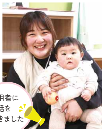
利用者に お話を 聞きました

昨年市外から転入してきた際にチラシを見て興味を持ちました。子どもが広いところで伸び伸びと遊ぶことができ、子ども同士・親同士で交流できるところが魅力です。保育士さんがいるので安心できますし、アットホームな雰囲気も気に入っています。