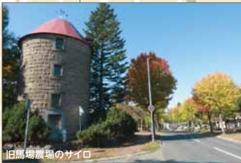
旧馬場農場のサイロ