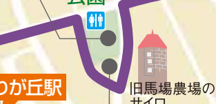
旧馬場農場のサイロ