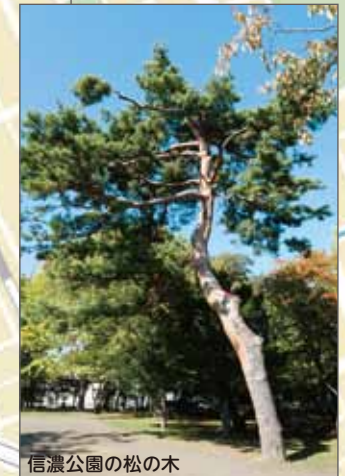
信濃公園の松の木