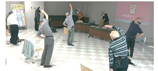
講義のあとに体を動かして、楽しくリフレッシュできました！

次年度も男性介護者のお役に立ちますように、ケア友の会の開催を検討していきたいと思っておりますので、興味のある方は、ぜひご参加ください！