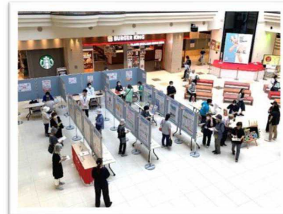
↑ 昨年の認知症パネル展の様子