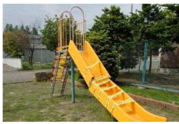
雪の重みで遊具が破損！