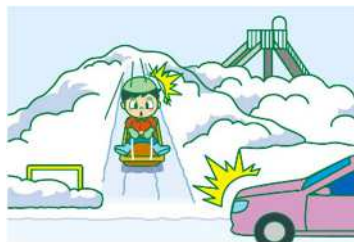
不慮の事故の恐れ！

原則、公園に雪を入れることは禁止されていますが、町内会等と札幌市との間で「覚書」を交わし、ルールを守ることで雪置き場として利用できます。