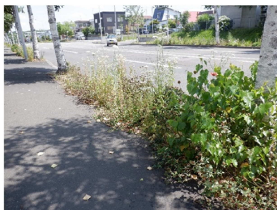
< 草刈り作業前の植樹帯の様子 >