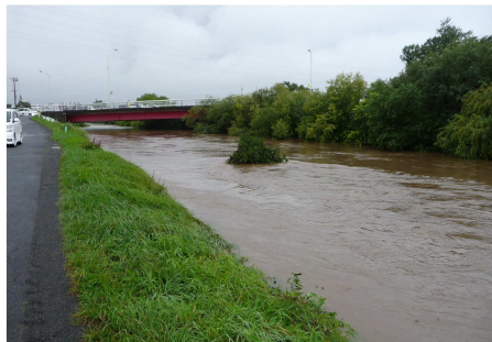
< 増水した厚別川の様子(平成26年9月11日) >

この白線まで雨水に浸かっていたら、 この先、アンダーパス内の最大水深が10cm という意味です。