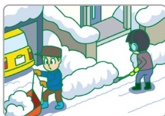
個人宅の間口除雪