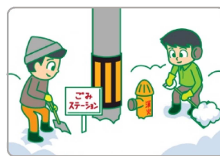
消火栓やごみステーション 周辺の除雪