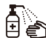
手指消毒用アルコール による消毒の励行

新型コロナワクチンの有効性・安全性などの詳しい情報については、厚生労働省ホームページの「新型コロナワクチンについて」のページをご覧ください。