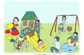
※遊具はイメージです

小さな子ども用の遊具のある公園が周辺に少ないことから、幼児を対象とした遊具を設置した遊び場を整備します。