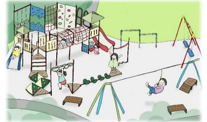
※遊具はイメージです

児童用の遊具を中心に、子ども達が元気いっぱい体を動かせるよう、「登る」、「すべる」、「渡る」、「ぶら下がる」、「くぐる」といったアスレチック的な要素を取り入れた遊具を設置します。