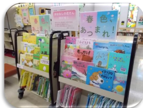
写真は去年の展示テーマ「春色、あつまれ！」の様子です

まだ雪も残り、寒い日が続きますが、ようやく春のきざしが感じられるようになってきましたね。こどもの読書週間にちなんだ「おはなしの花だん」の児童展示として、今年は「 本で楽しむ星と月 」をテーマにおこなう予定です。（期間は4/11~5/21の予定）どんな星や月と出会うことができるでしょうか。ぜひこの展示も楽しみにしてくださいね！