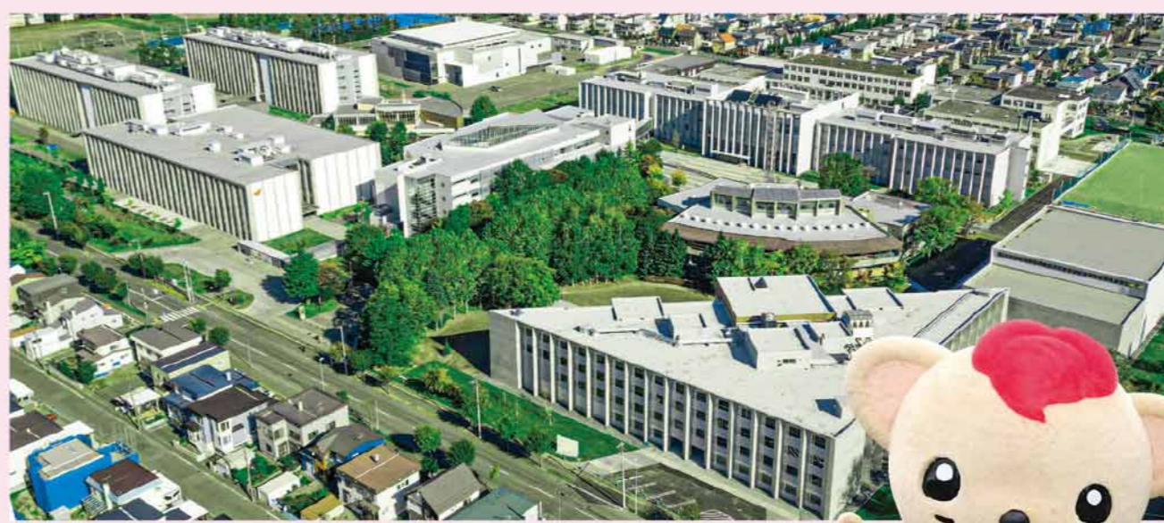
北海道科学大学 マスコットキャラクター「かがくガオー」▶

手作りちょうちんで夜を照らす夏の恒例イベント「ていね夏あかり」は令和3年度から大学で開催されており、冬に実施している「HUSキャンパス・イルミネーション」では体験イベントやコンサート等が行われます。令和5年4月から北海道科学大学高等学校が豊平区中の島キャンパスから移転し、幅広い年代の学生と生徒が地域との交流を深めています。