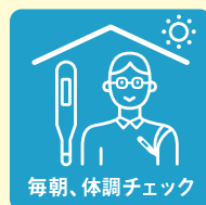
毎朝、体調チェック