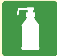
アルコール 消毒液