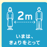
いまは、 ぎよりをとって