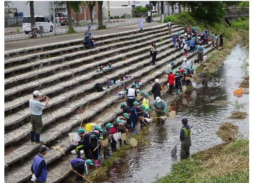
前田北小学校 4 年生児童 50 名が参加した手稲土功川生物観察会（7/6）