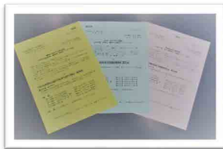
◆3団体の書面表決結果案内◆