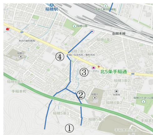
(稲積川) (稲積第1排水)

⇒① 6月上旬の稲積第1排水の上流では、ダムのような施設の工事が行われていました。これは、砂防堰堤と呼ばれるもので、溪流沿いに発生する土砂災害の軽減を目的に北海道が設置しているものです。中央部分を見るとコンクリートで固められていませんが、この工法は、透過型堰堤と呼ばれ、大雨が降り土石流が発生したとき、大きな岩や、流木などを含む土砂を引っ掛け、水だけを流すために造られたものです。