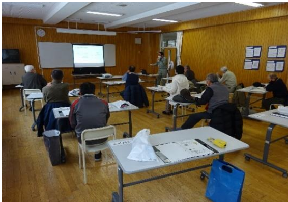
担当者から説明を受けています