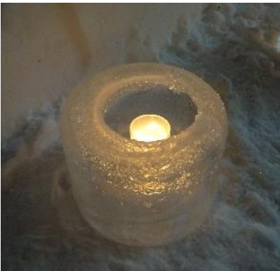
アイスクンドル拡大写真