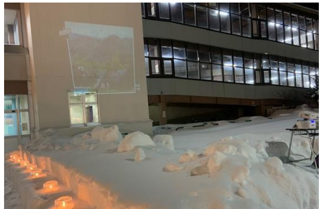
駅庁舎に投映された写真コンテスト入賞作品