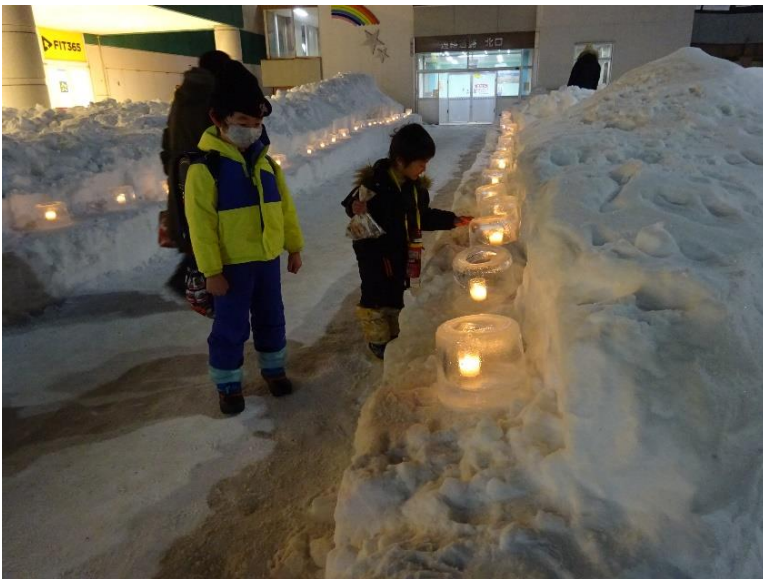
星置駅北口前のアイスクンドル