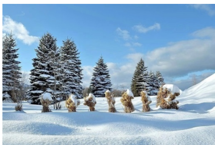
第8回 一般の部 最優秀作品 ～「アジサイの行進」～