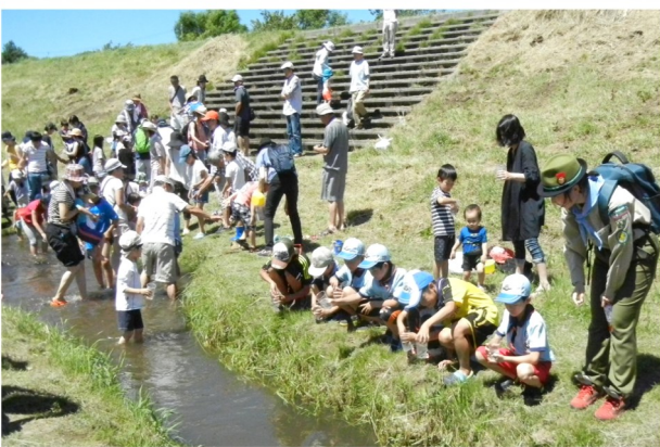
軽川と桜並木を育てる会「魚の放流会」 軽川と桜並木を育てる会 <H30.7.29>