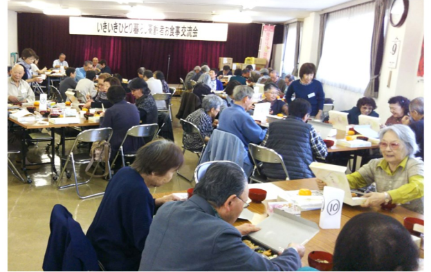
いきいきひとり暮らし高齢者お食事交流会（前田中央会館） 前田地区福祉のまち推進センター 695-9512（平日 10:00～12:00） <H30.10.9>