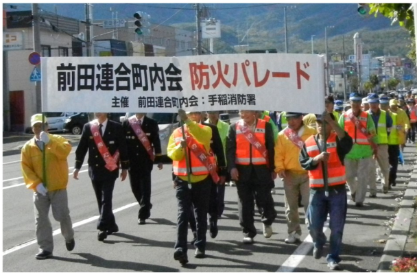
防火パレード 前田連合町内会