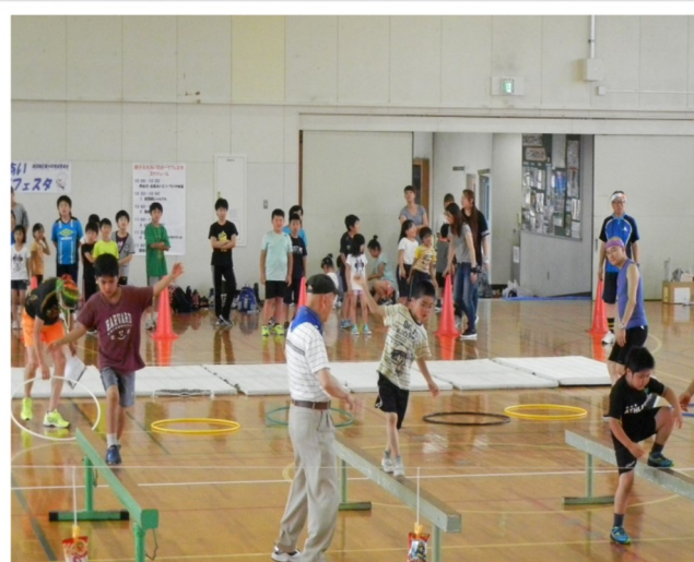
地域ふれあいスポーツフェスタ