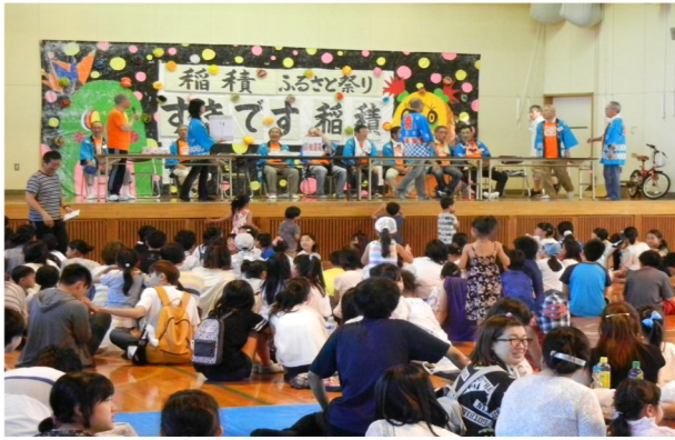
第20回稲積ふるさと祭り（稲積小学校） 稲積連合町内会 <H30.7.28>