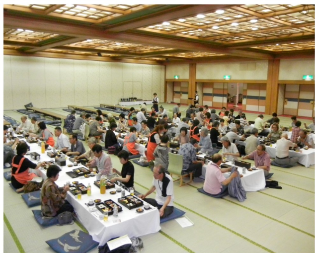
ひとり暮らし高齢者との日帰り温泉旅行