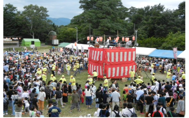
第23回前田ふれあいまつり（前田公園） 前田ふれあいまちづくり協議会 <H30.8.4>