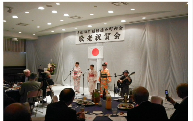
敬老祝賀会 稲積連合町内会