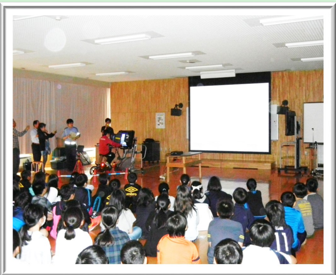
自転車安全教室（稲積小学校、富丘小学校）