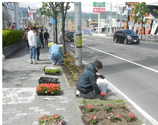
前田花街道植栽事業（石狩手稲線）