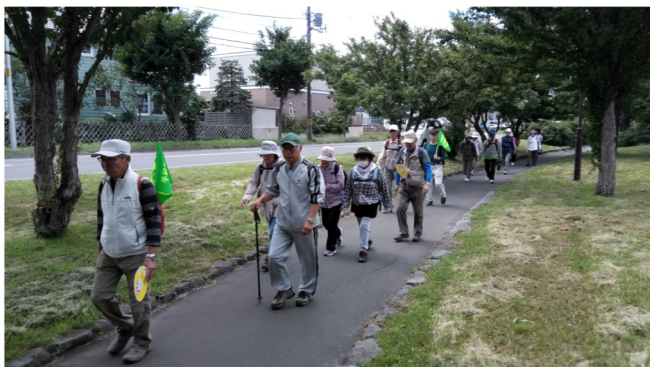
ウォーキング大会