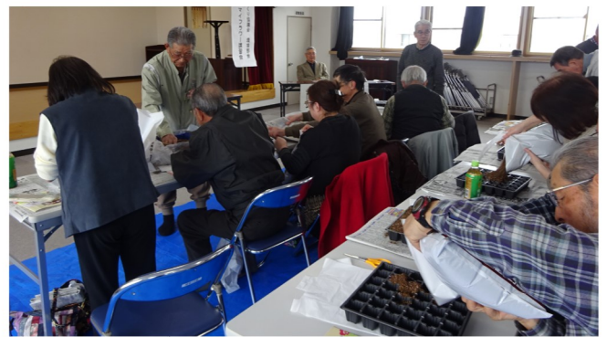
マイタウン・マイフラワー講習会