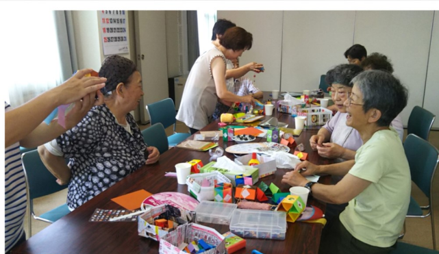
ほっこり広場 山口団地連合自治会 <R1.8.3>