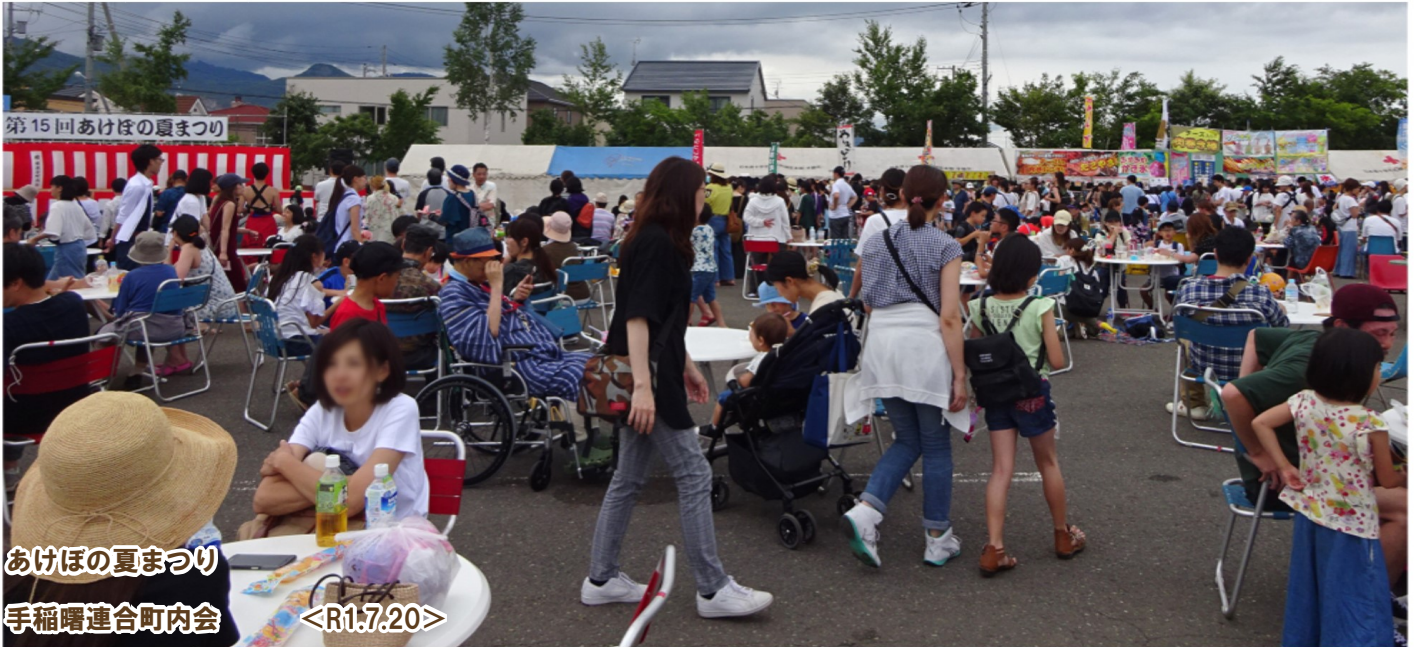
あけぼの夏まつり 手稲曙連合町内会