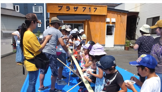
えがおの広場 手稲稲山連合町内会 <R1.8.3>