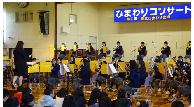
ひまわりコンサート