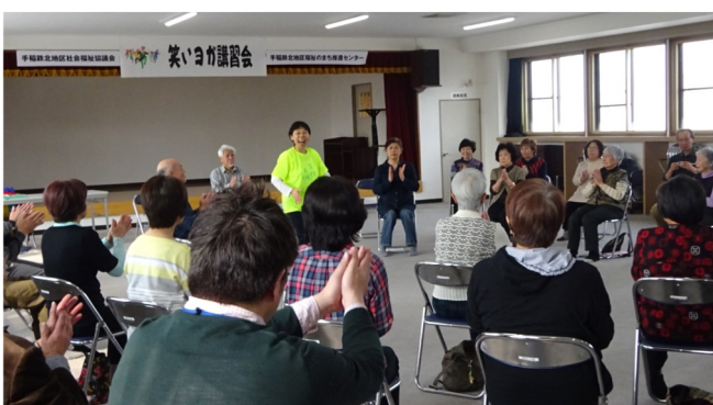
笑いヨガ講習会 手稲鉄北地区福祉のまち推進センター <H31.3.6>