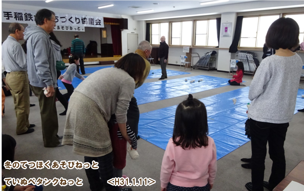
冬のでっほくあそびねっと ていぬベタンクねっと <H31.1.11>