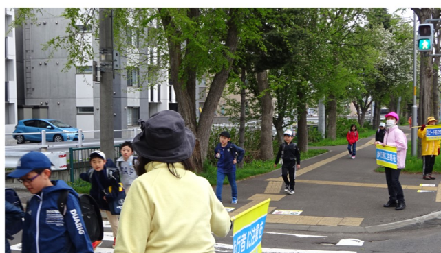
春の交通安全早朝一斉街頭啓発 手稲鉄北地区連絡協議会 <R1.5.10>