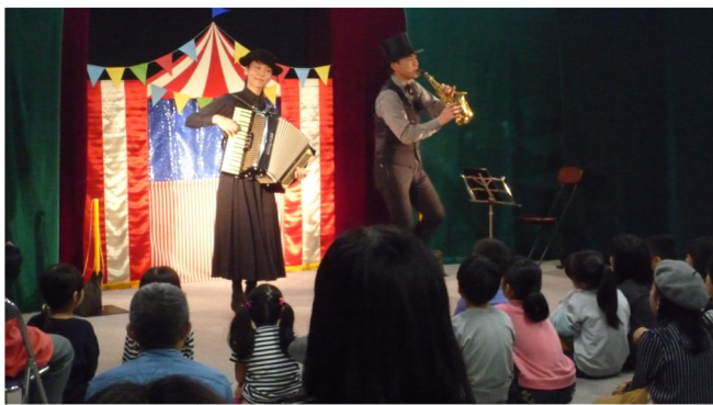
お楽しみ劇場ガウチョス