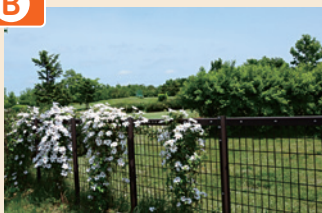
パークゴルフ場とクレマチス