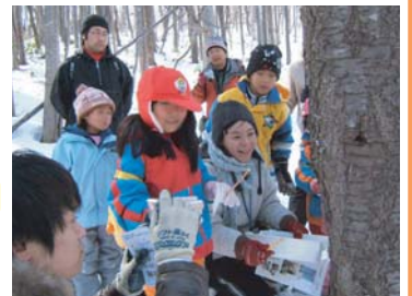
手稲山麓での観察会のようす