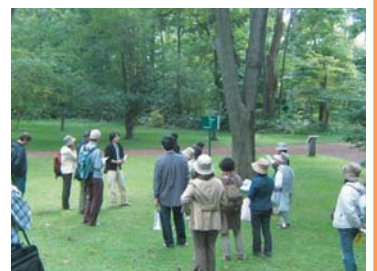
森林療法体験会のようす