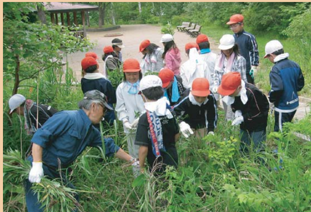
■総合学習の授業。作業指導は富丘丸山町内会の皆さん

手稲中央小学校の5年生が、昨年からの総合学習の授業の一環として、スズラン保全作業を行っています。授業以外でも観察会や保全作業に参加する生徒も多く、今年は、「子どもリーダー」も誕生しました。秋の大掃除には、富丘児童会館の子ども達と館長さんも作業に参加下さるなど、多くの子ども達が、取り組みの力になっています。