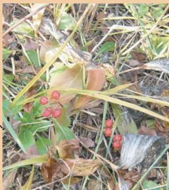
■今年のスズランの実