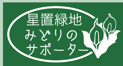
■みどりのサポーターの帽子のマーク

今後は、木道周辺のゴミ拾いや帰化植物の抜き取りなどの日常的な手入れも行っていく予定です。