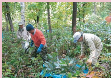
■秋のササ刈り作業の様子

秋には、周辺の町内会関係者の方を中心に、地域の皆さんによる初めての保全作業を行いました。翌年に美しいカタクリが咲くことを願って、来年もまた同様の作業を行う予定です。