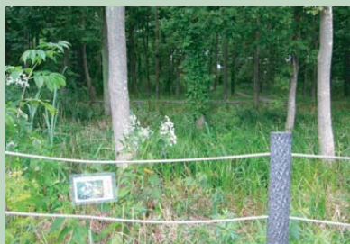
■見通しが良くなった東側入り口付近

今後は帰化植物の侵入も予想されますが、緑地の変化を観察しながら、状況に応じた手入れを続けていきます。