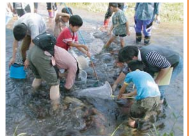
星置川での生き物さがしのようす

活動をしていて嬉しいことは、初めて参加した人が感激してくれるのを見ることです。身近にある自然を知りたい人、体験したい人はまだまだたくさんいると思いますので、そんな方達に私たちの活動をお知らせしていきたいです。