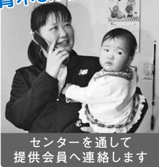
センターを通して提供会員へ連絡します