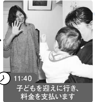
11:40 子どもを迎えに行き、料金を支払います

習い事や用事があるときに利用しています。最初は不安もありましたが、いつも同じ方に預けられるので安心できますし、助かっています。