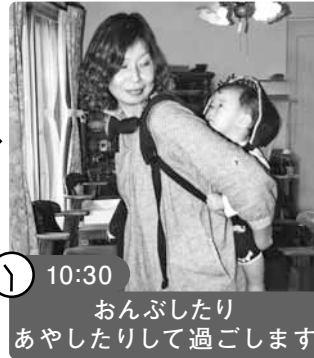
10:30 おんぶしたりあやしたりして過ごします