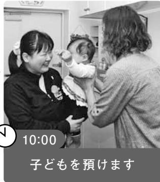
10:00 子どもを預けます