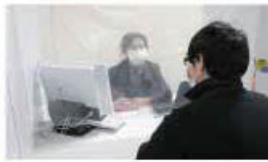
▲相談窓口はビニールシートを張る など感染症対策を行っている

求職登録(住所、氏名など)をした方を対 象に、相談員が話を聞き、就職活動をお 手伝い。一人一人に専任の相談員が付く ので、ニーズに合わせたきめ細かいサ ポートが受けられます。