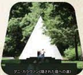
ダニ・カラヴァン(隠された庭への道)

▶作品の一部となる直径7m、高さ7mの円すい。床の中央部分にある、札幌の冬景色を見た際の印象を基に制作された「眠れる雪」にもご注目ください。