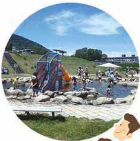
▲全長390メートルの遊水路に遊具が並びます

豊平川沿いにある、滑り台やポンプ、アスレチックなどの遊具が盛りだくさんの遊水路です。浅い人工の水辺で無料で楽しめるため、小さい子ども連れでも気軽に水遊びを満喫できます。