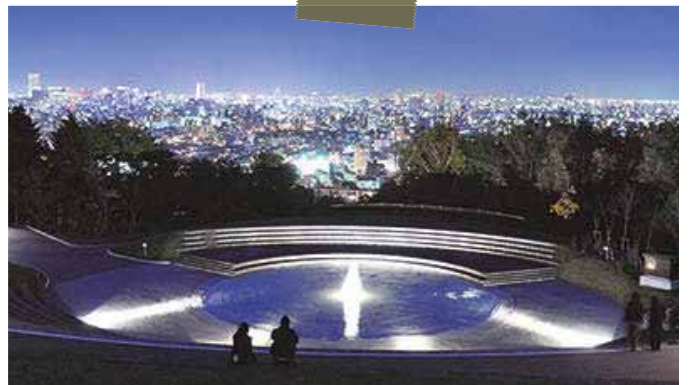
▲夏は20時～21時ごろに一番きれいな夜景が見られます

標高137・5メートルに位置する展望台から、ライトアップされた噴水と市街中心部のオフィスビルの色鮮やかな光が織りなす景色を堪能できます。無料の夜景スポットとして人気ですが、実は市の創建100年を記念して造られた公園。街の夜景だけでなく、山側に広がる星空も見逃せません！