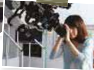
▶口径20センチの屈折望遠鏡で観察します