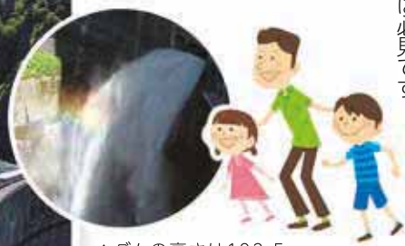
▲ダムの高さは102.5メートル。天気が良ければ虹が架かるかも!?

利用期間 11/3(祝)まで。8時45分～16時。バス下り最終便は16時30分 所在地 南区定山溪840 アクセス JR札幌駅から車で約1時間 駐車場 250台。駐車場からダムまで電気バスで約10分、徒歩で約30分 費用 電気バス乗車の場合往復620円、小学生300円 詳細 豊平峡電気バス ☎598-3452