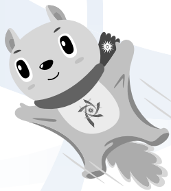
大会公式マスコット エゾモン