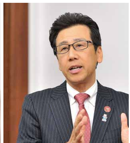
札幌市長 秋元 克広

小学2年生のときにスケートを始め、2003年・2004年世界ジュニア選手権に出場し、2年連続4位入賞。2003年ISUジュニアグランプリシリーズスロバキア大会で優勝。現在はアイスショーに出演するほか、テレビやラジオでスポーツキャスターとしても活躍中。