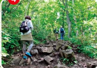
◀ 登山道に岩が目立つようになったら、山頂はもうすぐ！