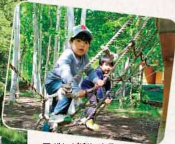
▲子どもが楽しめるアスレチックもあります

都会の喧騒 けんそう を離れて、自然と存分に触れ合えるのがキャンプの魅力。ここでは、市が管理するキャンプ場を紹介します。