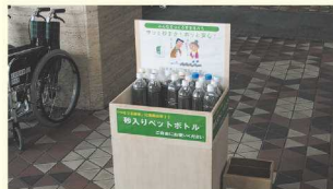
市役所などではペットボトル に入った砂も配布しています