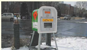
砂箱の砂は誰でも使えます ※道路への砂まきが対象です

冬のつるつる路面で活躍するのが砂。交差点や坂道などには「砂箱」が設置されているので、「滑って危ないな」と感じたら、砂をまきましょう!