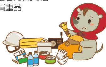
防災協会キャラクター「ボ-サちゃん」