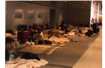
北海道胆振東部地震時の状況 (札幌駅地下歩行空間)