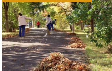
まち美化プログラム

区内の道路におけるボランティアによる清掃活動を支援し環境美化に対する市民意識の高揚を図り、市民・企業・行政の協働による活動を推進します。