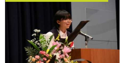
白石区中学生の主張発表会

中学生が自分の言葉で考えを主張することで、自ら考え表現する力の向上を図ります。また、白石区と歴史的に縁のある宮城県白石市と登別市の中学生を招待し、両市との交流を深めます。