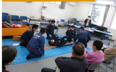
地域の防災訓練への支援

災害被害を軽減するために地域が行う防災訓練や研修会などの取り組みを支援することで、地域防災力の向上や防災意識の醸成を図ります。