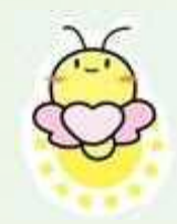
札幌市 地域包括支援センター イメージキャラクター 「ほッター」