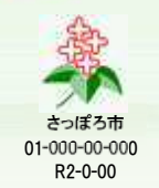
さっぽろ市 01-000-00-000 R2-0-00