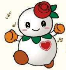
札幌市白石区マスコット キャラクターしるっぴー