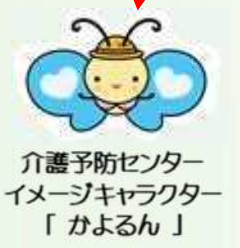
介護予防センター イメージキャラクター 「かよるん」