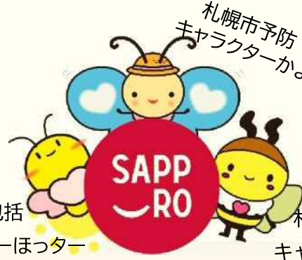
札幌市包括 キャラクターほっちゃん

ブルー色が運動の場だよ！ ピンク色が交流の場だよ！ 勇気をだして参加してみよう～ ご連絡お待ちしております。