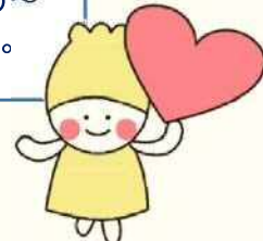
札幌市生活支援コーディネーター キャラクターまもりん

ブルー色が運動の場だよ！ ピンク色が交流の場だよ！ 勇気をだして参加してみよう～ ご連絡お待ちしております。