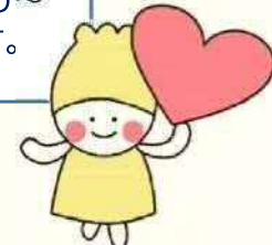
札幌市生活支援コーディネーター キャラクターさぼっちゃん

ブルー色が運動の場だよ！ ピンク色が交流の場だよ！ 勇気をだして参加してみよう～ ご連絡お待ちしております。