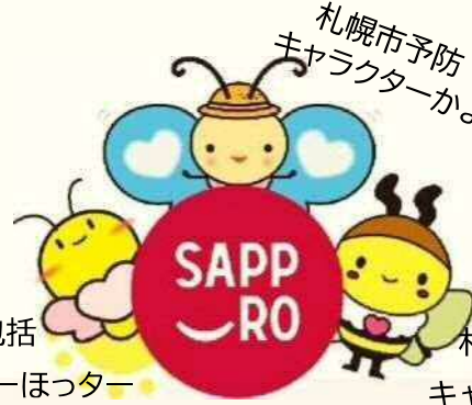
札幌市包括 キャラクターほっちゃん

ブルー色が運動の場だよ！ ピンク色が交流の場だよ！ 勇気をだして参加してみよう～ ご連絡お待ちしております。