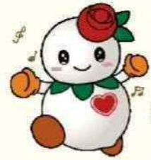
札幌市白石区マスコット キャラクターしるっぴー